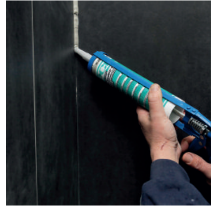
6. Eck-, Anschluss- und Bewegungsfugen elastisch schließen.