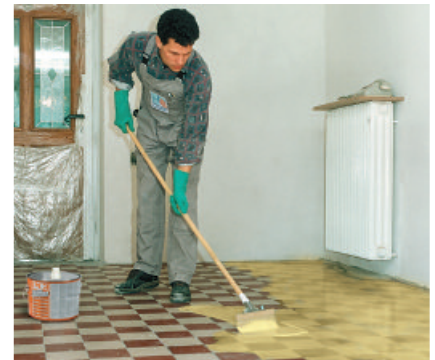
PCI Gisogrund 303 ist die sichere Haftgrundierung zum Verlegen von Belägen auf keramischen Fliesen und Platten.