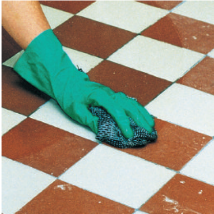
Untergrund mit geeignetem Reiniger von haftungsmindernden Rückständen säubern.

3 PCI Polycrret 5 bzw. PCI Pericret oder PCI-Fliesenkleber zur Verlegung von keramischen Fliesen- und Plattenbelägen auf die abgelüftete und ausgehärtete Grundierung aufbringen!