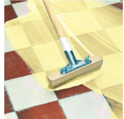
Grundierung auf dem Untergrund im "Kreuzgang" vollflächig verteilen.