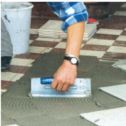
Nach ca. 30 bis 45 Minuten können nachfolgende Oberbeläge mit PCI-Fliesenklebern aufgebracht werden.