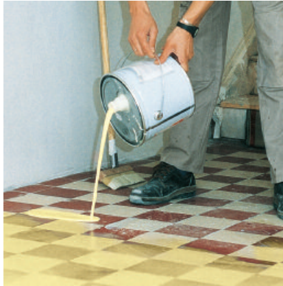
PCI Gisogrund 303 gründlich aufschütteln und auf den Untergrund ausgießen.