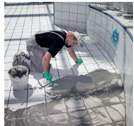
PCI Durafug NT zum Verfugen von keramischen Belägen mit erhöhter mechanischer Belastung und Beanspruchung, z. B. in Schwimmbädern.